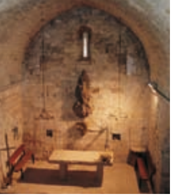
Iglesia de Santa María © MHC

Para llegar a La Tossa hay que regresar a la C-37 y girar a mano izquierda en dirección a Igualada. En el km 60 está el desvío que lleva hasta la fortaleza. Entre otros, señorearon el castillo el conde Borrell II, el rey Jaume II, y los Cardona. Actualmente pertenece a la Fundació la Tossa. En el año 2004 se creó un consorcio entre el Ayuntamiento de Santa Margarida de Montbui y la fundación a fin de completar la recuperación y la optimización del monumento y de su entorno.