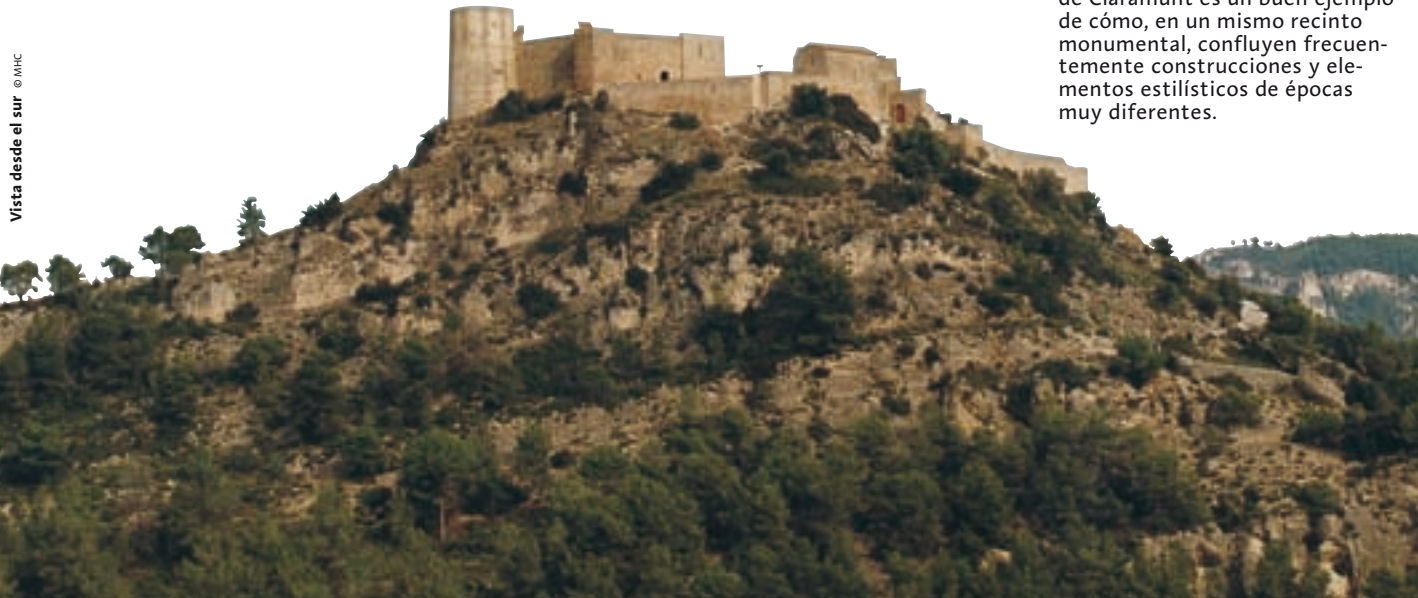
Vista desde el sur

El territorio capturado en todo el país a lo largo del siglo X y en las primeras décadas del XI se estructura en una red densa y completa de castillos con jurisdicción que se convierten en la unidad territorial y jurisdiccional básica en la zona fronteriza o marca de cada condado. Los castillos edificados en este período responden a la necesidad de controlar y defender el territorio. Suelen ser fortalezas de dimensiones muy reducidas, encumbradas sobre peñascos de difícil acceso y con un excelente campo visual. La documentación de las fortificaciones que les proponemos se inició en la segunda mitad del siglo X . Su exploración les permitirá seguir las huellas de la gente que en ellas vivió durante la Edad Media.