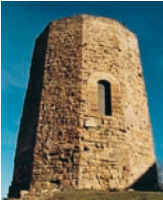
Torre del castillo con la puerta original

La torre, que ha sido datada en el siglo XII , es de propiedad municipal. Su ubicación estratégica, cerca del portal de entrada a la fortaleza, permitía defender el flanco más vulnerable y accesible. Está edificada con sillares de arenisca y alcanza una altura de más de 10 metros. Su perímetro endecágono (de once lados) aún conserva parte del enfoscado original. Los paramentos de fachada se elevan ligeramente inclinados confirriendo a la obra una