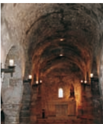
Torre maestra

deadas. Considerando sus dimensiones, cabe suponer que tenía funciones residenciales. En los paramentos, contruidos con bloques de piedra simplemente desbastados, se ven varias hiladas de opus spicatum . La puerta original de acceso se encuentra a la altura del primer piso, hecho muy habitual en la Alta Edad Media. Parece coherente datar el edificio en el siglo X . La planta baja acoge, en dos salas, diferentes exposiciones. A ambos lados de la torre, unos