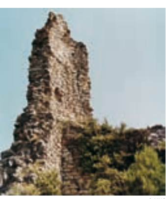
Restos de la torre principal del castillo de Vilademàger

Después de haber visitado el castillo de Miralles, si se dispone de tiempo existe la opción de dirigirse al de Vilademàger, dentro del término municipal de La Llacuna, y al de Queralt, en Bellprat, que se encuentran relativamente cerca. Hay que bajar a la C-37, girar a mano derecha y más adelante, en la rotonda, tomar la salida de La Llacuna. Al llegar al pueblo hay que girar en dirección a Sant Joan de Mediona (está señalizada). Justo antes de llegar al rótulo de final de población, hay que desviarse a la derecha siguiendo la señal del camping. Se prosigue por una pista hasta que, pasado el cementerio, se llega a una pequeña explanada con un desvío. Les aconsejamos que recorran a pie el tramo que va desde ese punto hasta el castillo.