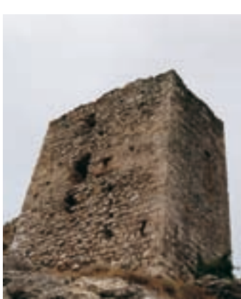
Torre del castillo de Miralles © MHC

La fortaleza, una de las más extensas de la comarca, se compone de dos recintos, el soberano y el inferior. En ambos las defensas naturales complementan perfectamente el sistema defensivo castral. Es una estrategia que constatamos con mucha frecuencia en los castillos de frontera. Les proponemos abrir el recorrido por la primera línea de defensa, donde se conservan restos de construcciones adosadas a la muralla, probablemente casas, y dos torres. La mayor, situada en el extremo sudeste, ha sido datada en la época bajomedieval. Ejercía una importante función de control sobre el acceso a la fortificación. A pesar de hallarse desmochada y abierta por todos lados, ha sobrevivido a los derridos y las maldades del pasado con mayor fortuna que las demás