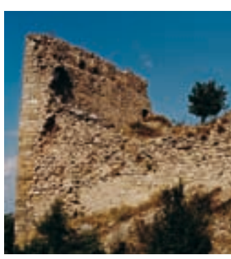
Ruinas del castillo

Hay que regresar a la rotonda de la C-37 recorriendo al revés el trayecto anterior. Luego hay que seguir por la carretera B-220 en dirección a Santa Coloma de Queralt y Bellprat. Unos 100 m después de la señal del km 8 se tiene que girar a la derecha. Cuando se han recorrido 2,9 km de pista, se llega a la iglesia románica de Sant Jaume, a los pies del castillo. Les recomendamos comenzar el itinerario en esta iglesia, que está totalmente restaurada. A continuación, un senderuelo empinado lleva hasta el castillo, sobre una formación rocosa. Hay que extremar la prudencia durante los últimos metros y, especialmente, en la fortaleza. El alto dominio del castillo estaba inicialmente en poder de los condes de Barcelona que, en el año 976, lo vendieron al vizconde Guitard. Posteriormente pasaría a formar parte de la baronía de Queralt. Está emplazado a 851 m de altura, en uno de los puntos más elevados de la sierra de Miralles-Queralt. Su espectacular control visual abarca numerosas fortificaciones, entre las que se encuentra Vilademàger. Queralt ejemplifica la importancia que tenía la intercomunicación en caso de peligro.