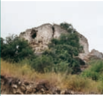
Castillo de Miralles

El romero ( Rosmarinus officinalis ) Es una de las hierbas aromáticas más conocidas. En realidad, es un arbusto que puede alcanzar el metro y medio de altura. Los tallos son leñosos y las hojas, lineares; características que le permiten soportar bien la sequía. Se utiliza en la cocina y en la medicina popular.