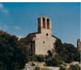
Iglesia de Sant Pere del castillo de Vilademàger

Después de haber visitado el castillo de Miralles, si se dispone de tiempo existe la opción de dirigirse al de Vilademàger, dentro del término municipal de La Llacuna, y al de Queralt, en Bellprat, que se encuentran relativamente cerca. Hay que bajar a la C-37, girar a mano derecha y más adelante, en la rotonda, tomar la salida de La Llacuna. Al llegar al pueblo hay que girar en dirección a Sant Joan de Mediona (está señalizada). Justo antes de llegar al rótulo de final de población, hay que desviarse a la derecha siguiendo la señal del camping. Se prosigue por una pista hasta que, pasado el cementerio, se llega a una pequeña explanada con un desvío. Les aconsejamos que recorran a pie el tramo que va desde ese punto hasta el castillo.