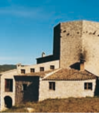
Torre poligonal con edificaciones adosadas

Se desciende por el camino del castillo de Claramunt y nada más llegar a la carretera hay que girar a la derecha. Algunos metros más adelante hay que enlazar con la BV-2131. A la altura del km 7, hay que desviarse a mano izquierda por la BV-2132. El castillo se halla situado sobre un roquedal en el margen derecho de la rambla de Carme, con un buen control sobre el valle. Desde el siglo XIII aparece vinculado principalmente a la casa Cardona. En el año 1320, a causa de unas disputas entre Ramon Folc de Cardona y el infante Alfons, éste hizo demoler el castillo.