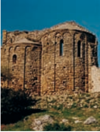
Ábside de la iglesia de Santa María

La primera muralla, reforzada por garitas de flanqueo, envuelve y protege el recinto inferior dibujando un largo recorrido desde la torre cuadrada norte hasta el portal de acceso. En el ángulo noreste de la fortaleza, se desvía y baja por el despeñadero hasta llegar al punto más inaccesible. El aparato constructivo de la obra, a pesar de haber sufrido